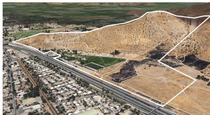
Identificación 58 ha. Disponibles de propiedad fiscal, Primera etapa Parque Metropolitano

*La licitación “Mejoramiento y ampliación Parque Metropolitano Cerro Chena”, ID 1261-10-LR16, considera la ejecución del proyecto detonante mencionado