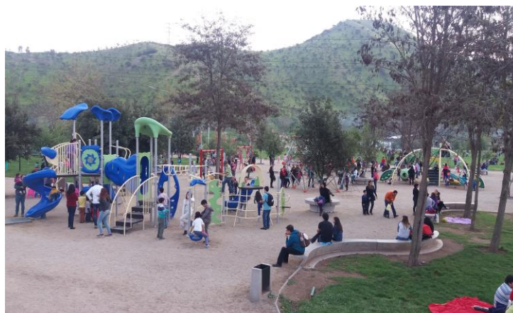
Puesta en marcha nueva zona de juegos Parque Cerro Chena