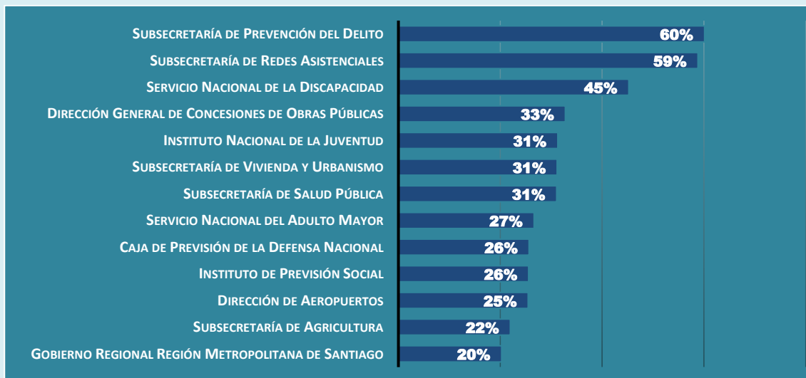
Gráfico 2. Estado de Avance Financiero del PROPIR al 1er Trimestre 2021. Instituciones sobre 20% de Ejecución.